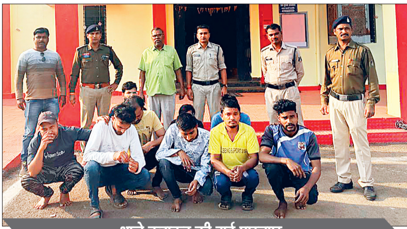
थाने बुलाकर की गई पूछताछ

थाना क्षेत्र में आनलाईन माध्यम से लोगों से टगी करने वालों पर सतत नजर रखी जा रही है। इसी क्रम में भारत सरकार गृह मंत्रालय द्वारा संचालित समन्वय पोर्टल के माध्यम से थाना बालोद क्षेत्र के बैंक ऑफ महाराष्ट्र बालोद शाखा के म्यूल एकाउंट खाता धारकों का अवलोकन किया गया। इस दौरान पाया गया कि बैंक ऑफ महाराष्ट्र आईएफसी कोड एमएएस 002398 में कुल 10 बैंक ऑफ महाराष्ट्र खाता धारकों के एकाउंट में देश के अलग-अलग राज्यों में हुए अनेक लोगों से हुई टगी के अलग-अलग कुल रकम करीब 3,19,145 रूपये को 10 खातों में प्राप्त किया गया है। माना जा रहा है कि यह सायबर फ्राड की राशि है।